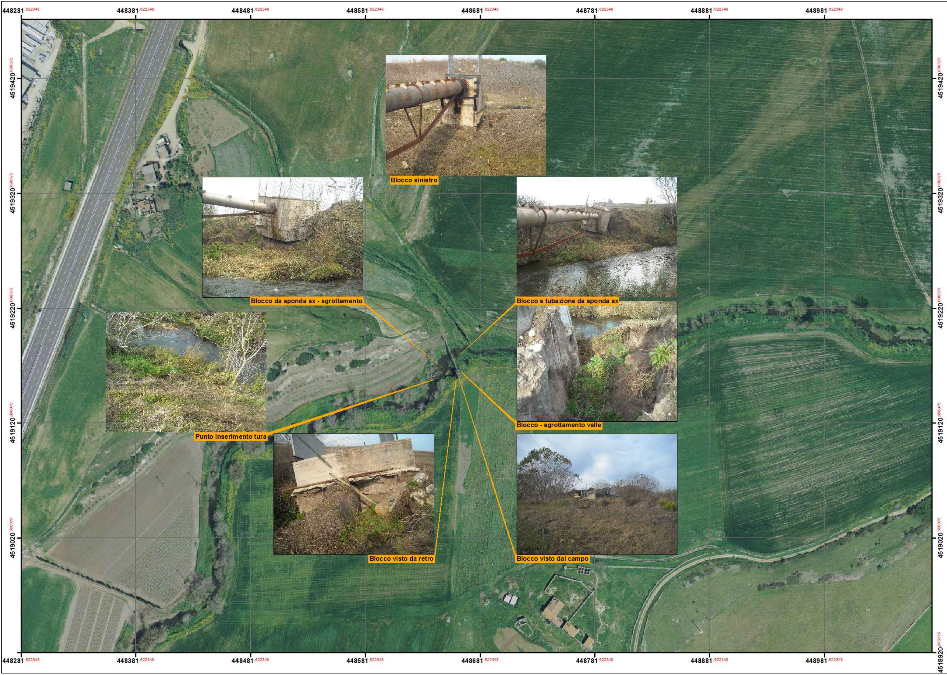
STRALCIO ORTOFOTO con documentazione fotografica dello stato attuale Scala 1:2.000