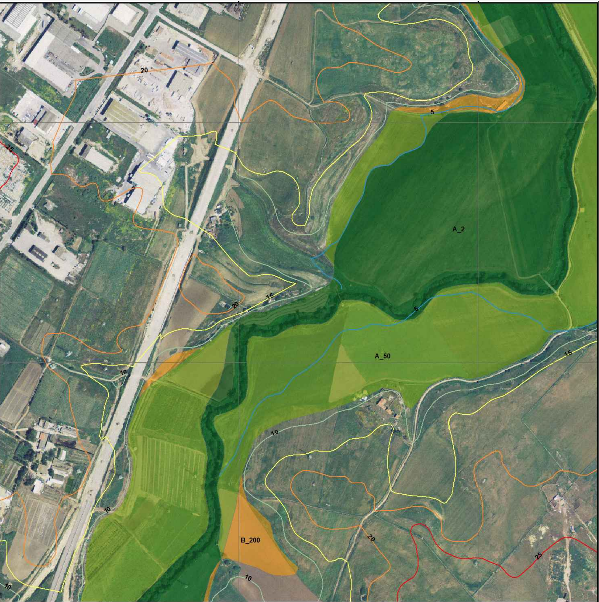
STRALCIO ORTOFOTO con indicazione del PAI Scala 1:5.000